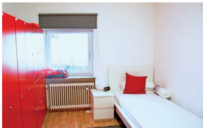
Ruheraum mit Schlafplatz und Spinden