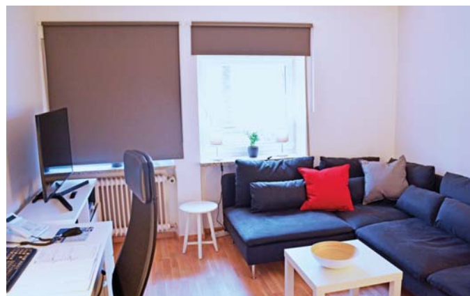
Aufenthaltsraum und Büro