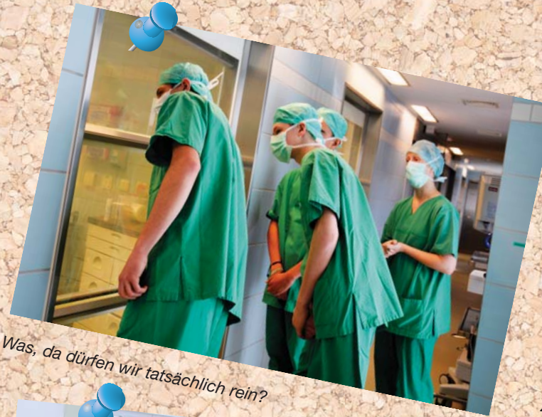
Was, da dürfen wir tatsächlich rein?