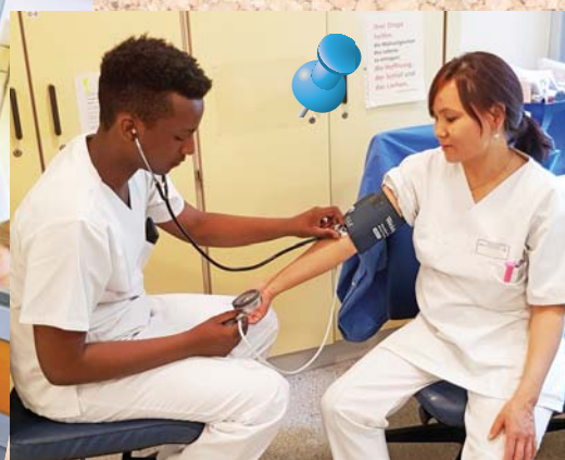
Der junge Mann durfte anschließend reihum vielen Mitarbeiterinnen und Mitarbeitern auf der Station G-1 den Blutdruck messen.