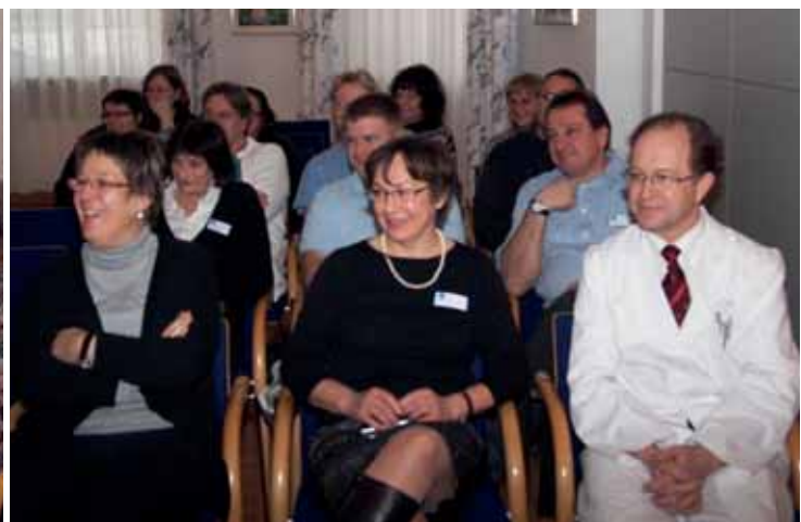
Mitarbeiter aus allen Abteilungen lauschen gespannt den Erläuterungen der Auditorin