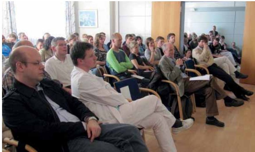
Zwei Räume in der Konferenzsperre füllten die 120 Teilnehmer des Intensivmedizin-Symposiums