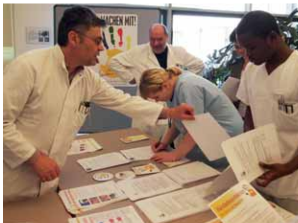
Das Infomaterial fand reißenden Absatz

„Die „AKTION Saubere Hände“ ist eine nationale Kampagne zur Verbesserung