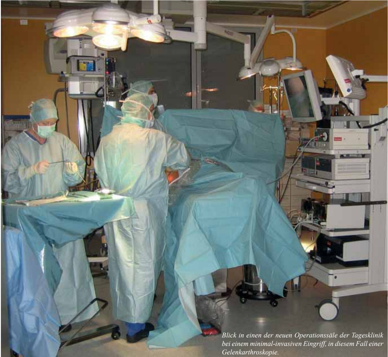
Blick in einen der neuen Operationssäle der Tagesklinik bei einem minimal-invasiven Eingriff, in diesem Fall einer Gelenkarthroskopie.