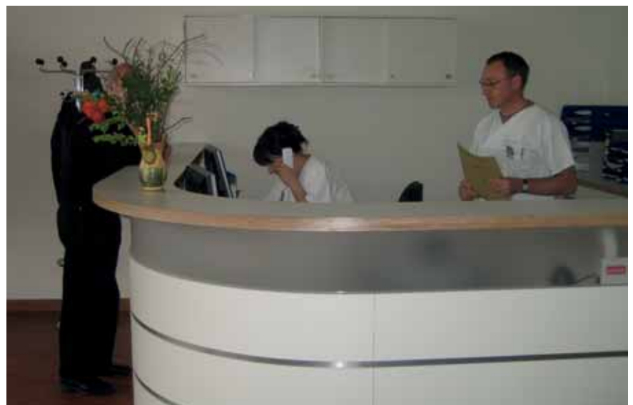
Empfangsbereich der Tagesklinik

für ältere Menschen geeignet, die sich in ihrem vertrauten Umfeld oft besser erholen.“ Der Anästhesist kontrolliert alle lebensnotwendigen Funktionen des Patienten während des Eingriffs und anschließend im Aufwachraum, der mit modernster Überwachungstechnik ausgestattet ist. Der neue Aufwachraum mit bis zu neun Überwachungsplätzen sowie der behagliche Ruhebereich mit Teeküche, Wasserspender und Fernseh-